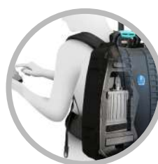
ALLOGGIATO NELLO ZAINO ROBUSTO CABLATO