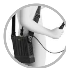
INDOSSABILE A TRACCOLLA*