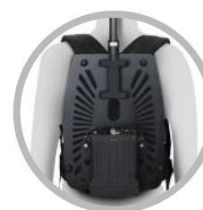
FISSATO ALLA PIASTRA ULTRA LEGGERA*