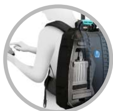
ALLOGGIATO NELLO ZAINO ROBUSTO CABLATO*