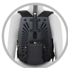
FISSATO ALLA PIASTRA ULTRA LEGGERA*