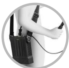
INDOSSABILE A TRACCOLLA